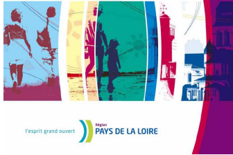
Schéma régional de développement du tourisme et des loisirs 2007-2011